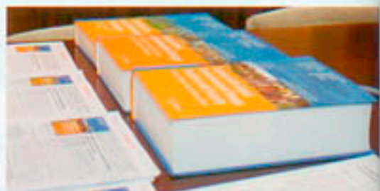
Podczas seminarium zaprezentowana została również seria Hexagon wydawana przez Wydawnictwo Springer.